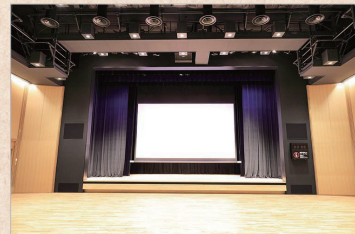
▶ ホール (客席収納)